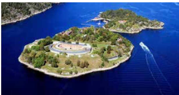
Oscarsborg i Frogn kommune. Hovedfestningen, Oscarsborg, ble anlagt på Søndre Kaholmen i Drøbaksundet i 1855.