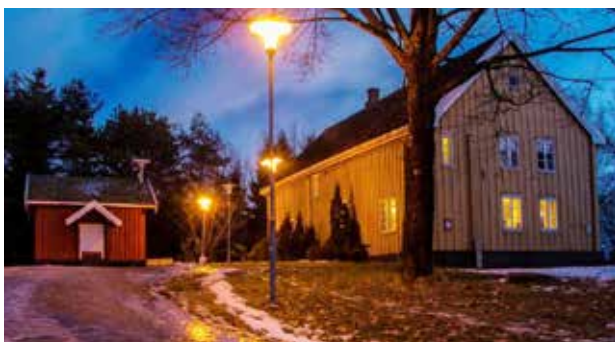
Ustvedthuset i Ski, der historielaget har kontor, ligger på Waldermarhøy i sentrum av Ski.