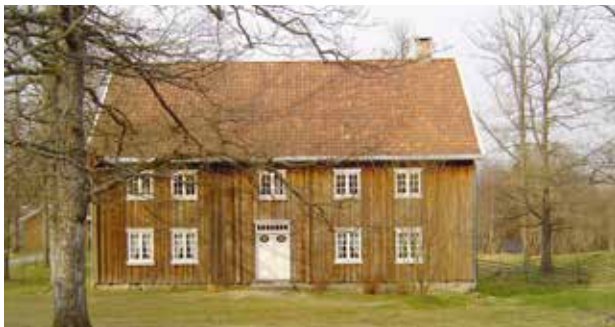
Våningshus fra Børsum gård i Ås. Flyttet til tunet på Follo Museum i Frogn.